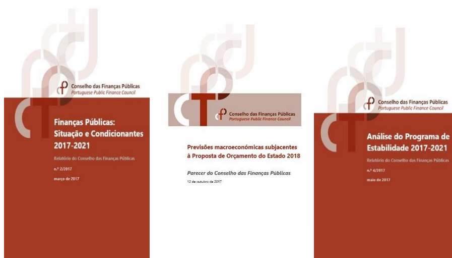
Exemplo de publicações do CFP divulgados em 2017

This chapter describes the services provided by the CFP in 2017. It refers to the published analyses, Senior Board members' public interventions, relations with other institutions, as well as participation in international networks of its counterparts.